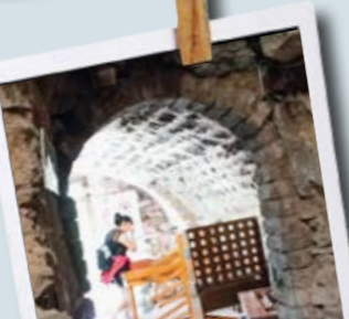
Des Jeux pour toute la famille