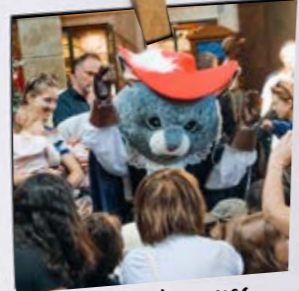
Ma rencontre avec Le Chat Botté