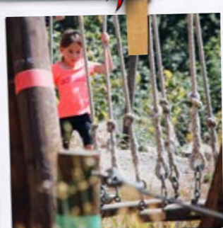
Parcours aquabranche pour les téméraires