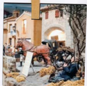
Superbe maquette Loups du Gévaudan