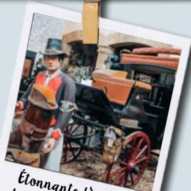
Étonnante l'histoire des Bottes de 7 lieues