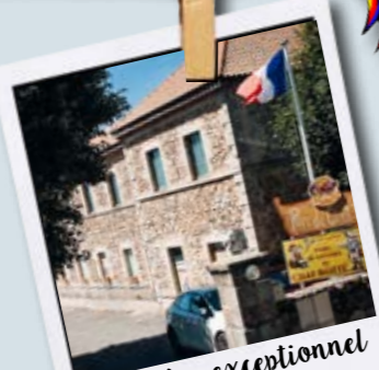
Un cadre exceptionnel à 1150m d'altitude