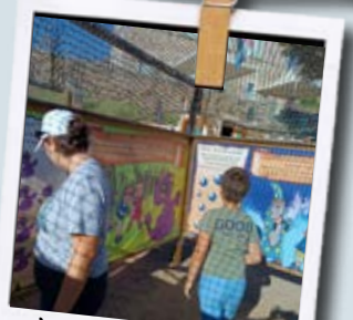
La chasse au trésor au Parc des Pirates