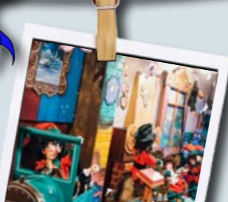
Surprenant ce village des Automates