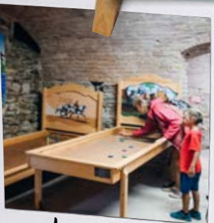
Les jeux en bois sont magnifiques !